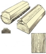
Joonis 1 - Tangentsiaallõige

Spoon ehk kattevineer on õhuke puiduleht, mis on saadud puidupakust hõõveldades või koorides. Puidu lõikamine spooniks on puitmaterjali säästlikum kasutamise viis. Spooni kasutatakse erinevate puitplaatide, uste, treppide jne pealistamiseks. Vastavalt kasutuskohale valmistatakse spooni 0,3 – 3mm paksust. Standard paksused on 0,6mm; 1,5mm ja 2,5mm. Olenevalt puiduliigist või spetsiaalsele tellimusele võivad paksused erineda. Kasutuskohad vastavalt paksusele: 0,6mm – mööbel, siseuksed, sisustuselemendid; 1,5 mm – trepid, välisüksed, servad; 2,5 mm – trepid, servad. Spooni tekstuur sõltub lõikamise viisist. Peamised lõikamisviisid ja nendest tulenevad tekstuurid on järgmised: