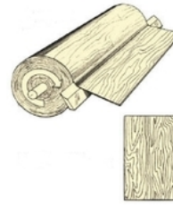
Joonis 3 - Koorimine

Esineb ka teisi lõikamisviise (rift, poolkaar jne), kuid need on edasiarendused nendest põhiliselt kasutatavatest viisidest.